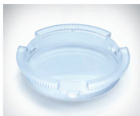
Nova lente de redução com aumento da eficiência cirúrgica