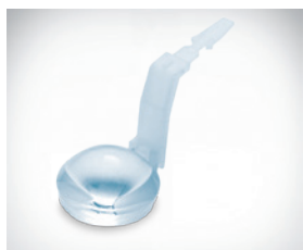
BIOM ® HD Disposable Lens